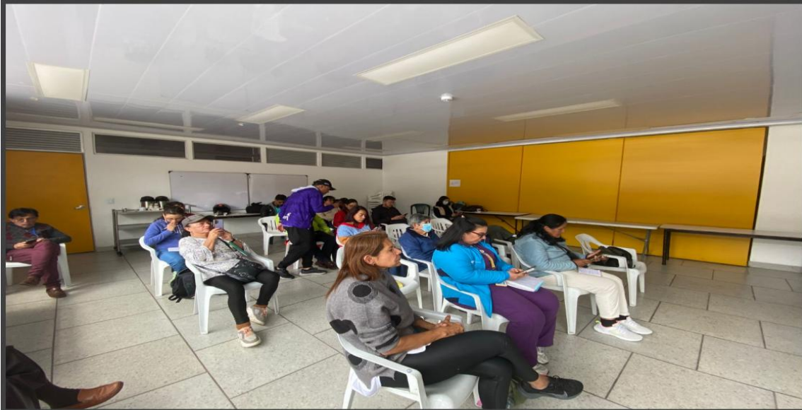
Asistencia de la comunidad e institucionalidad.